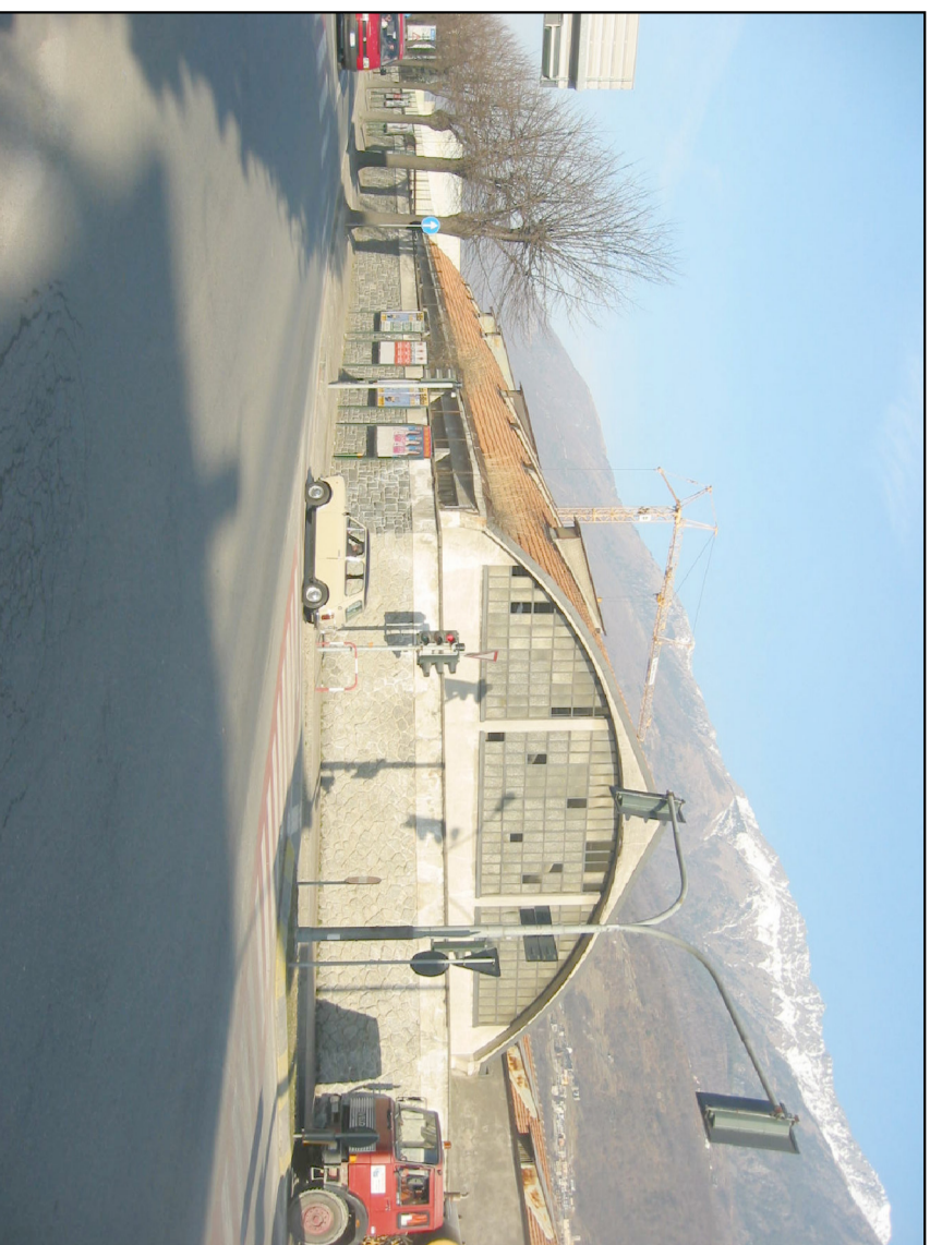
VIA MARTIGNELLI ANGOLO SS 38 VERSO OVEST