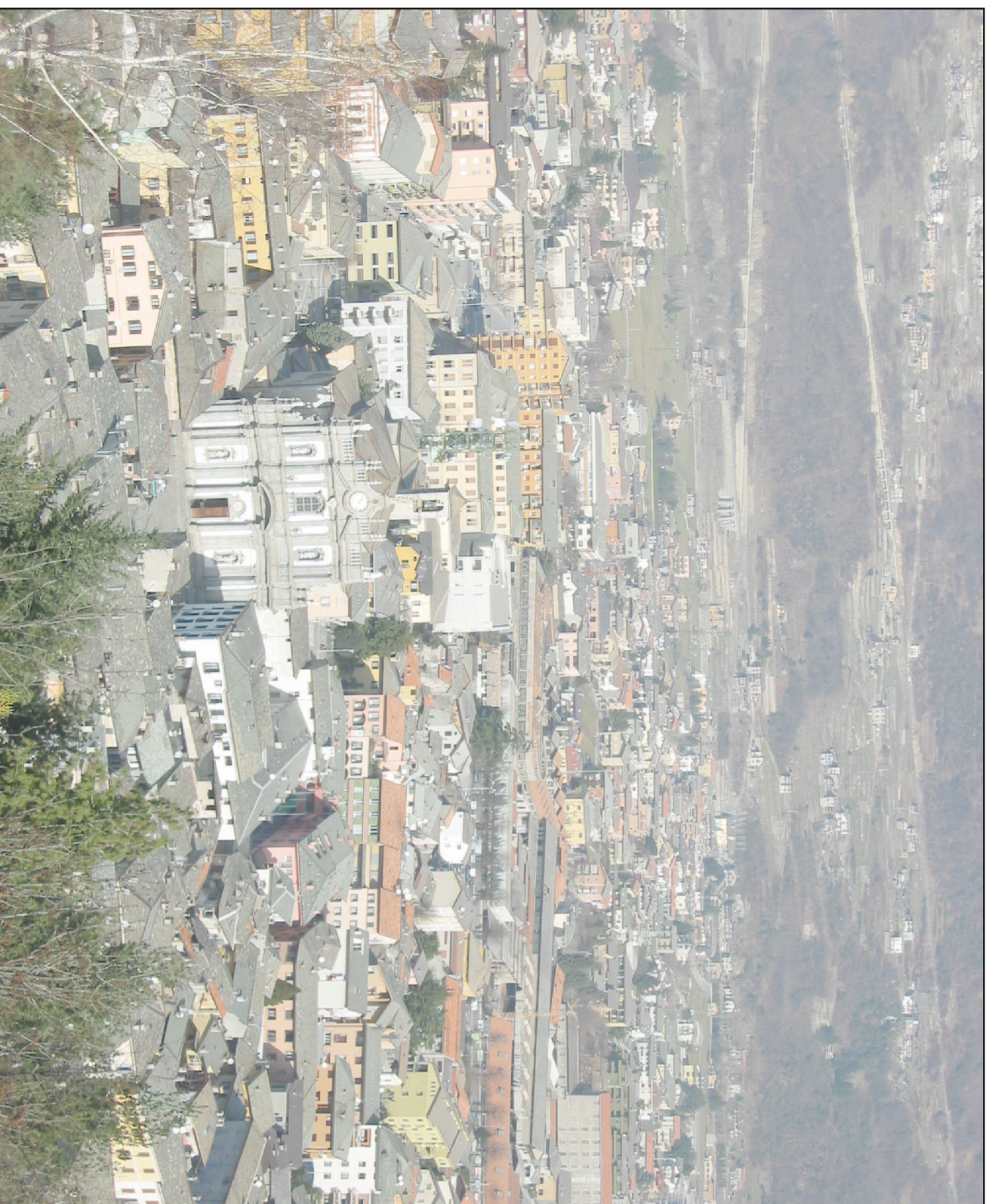
FOTO DALL'ALTO VERSO NORD