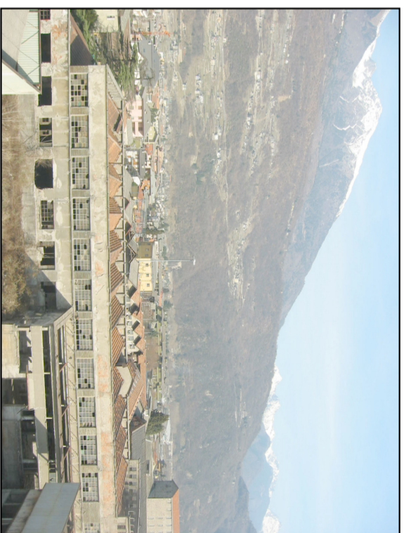
AREA EX - MARTIGNELLI