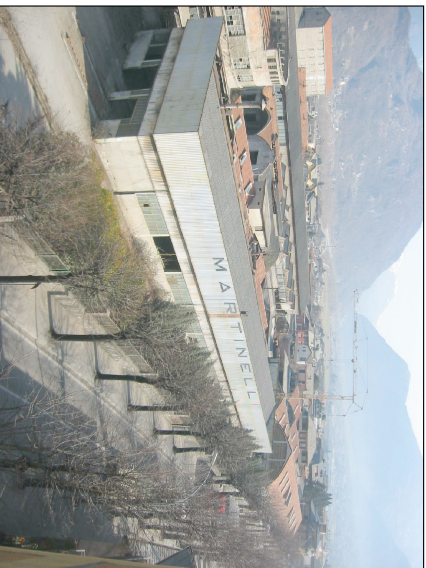
AREA EX - MARTIGNELLI

Antonio Citterio and Partners 20122 - via Cerva 4 - Milano - Italia Tel + 39 02 7638801 Fax + 39 02 76388080 http://www.antonio-citterio.it info@antonio-citterioandpartners.it