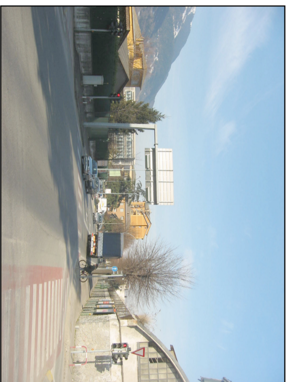
SS 38 VERSO OVEST