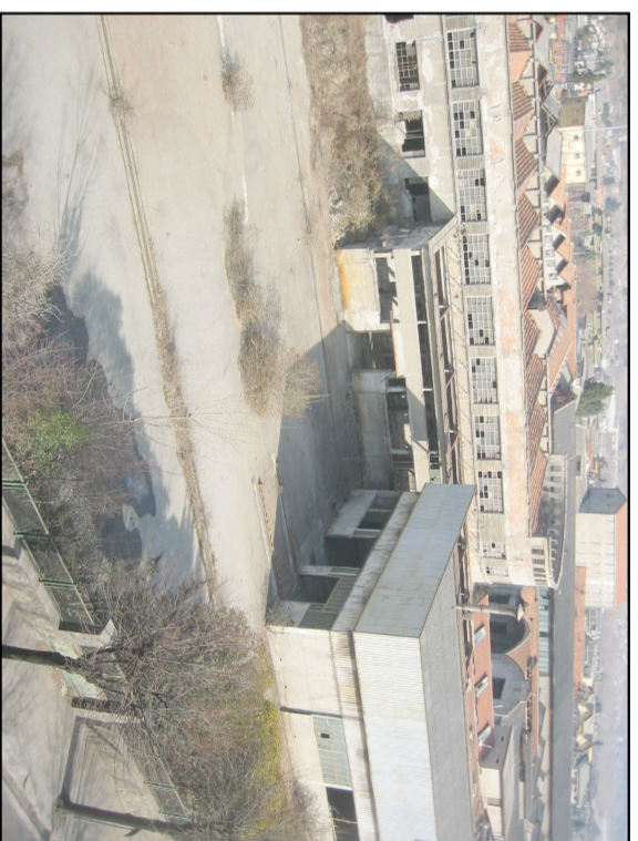
AREA EX - MARTIGNELLI