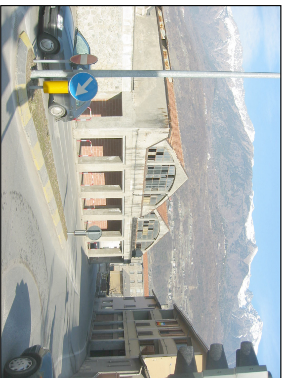
VIA MARTIGNELLI ANGOLO SS 38 VERSO SUD