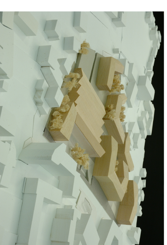
VISTA DEL MODELLO DA SUD-OVEST