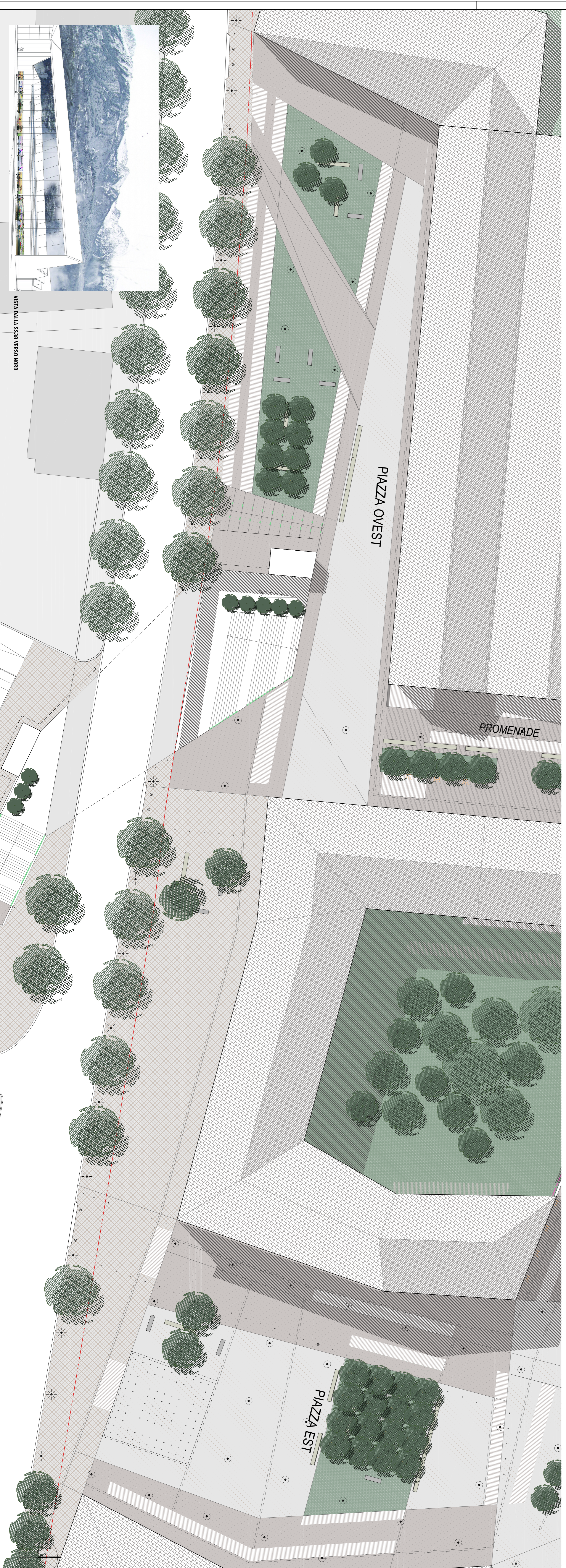
VISTA DALLA S538 VERSO NORD

Antonio Clerico and Partners 20122 - Via Sforza 4 - Milano - Italia Tel. +39 02 7038801 Fax +39 02 7038802 http://www.antonioclerico.it info@antonioclerico.com