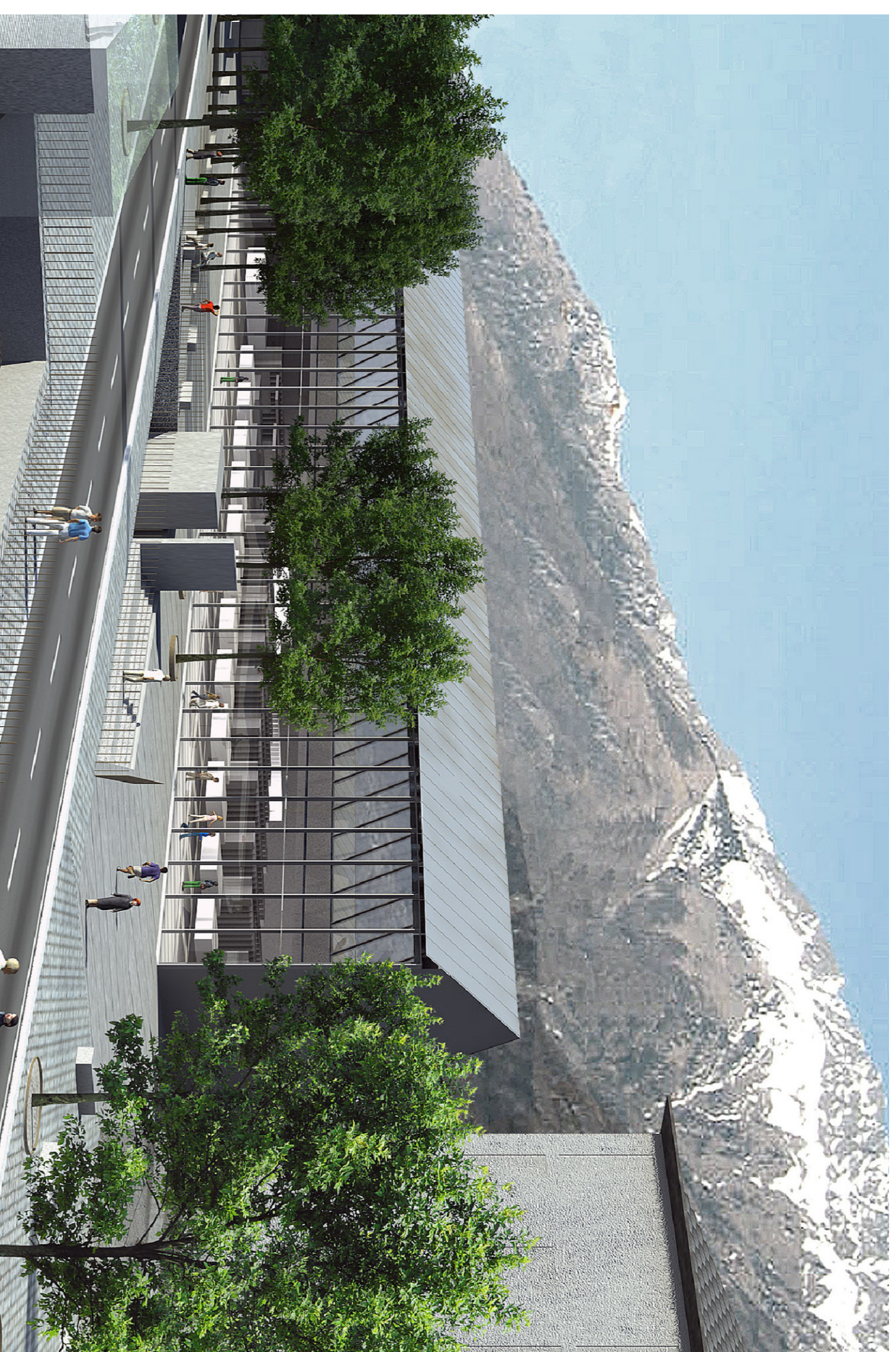
VISTA DA VIA FIEIDO VERSO NORD-OVEST