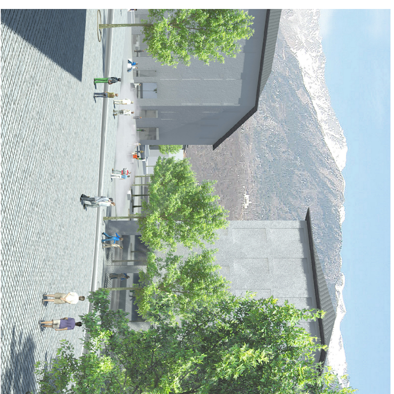
VISTA DA VIA MARGNA VERSO NORD