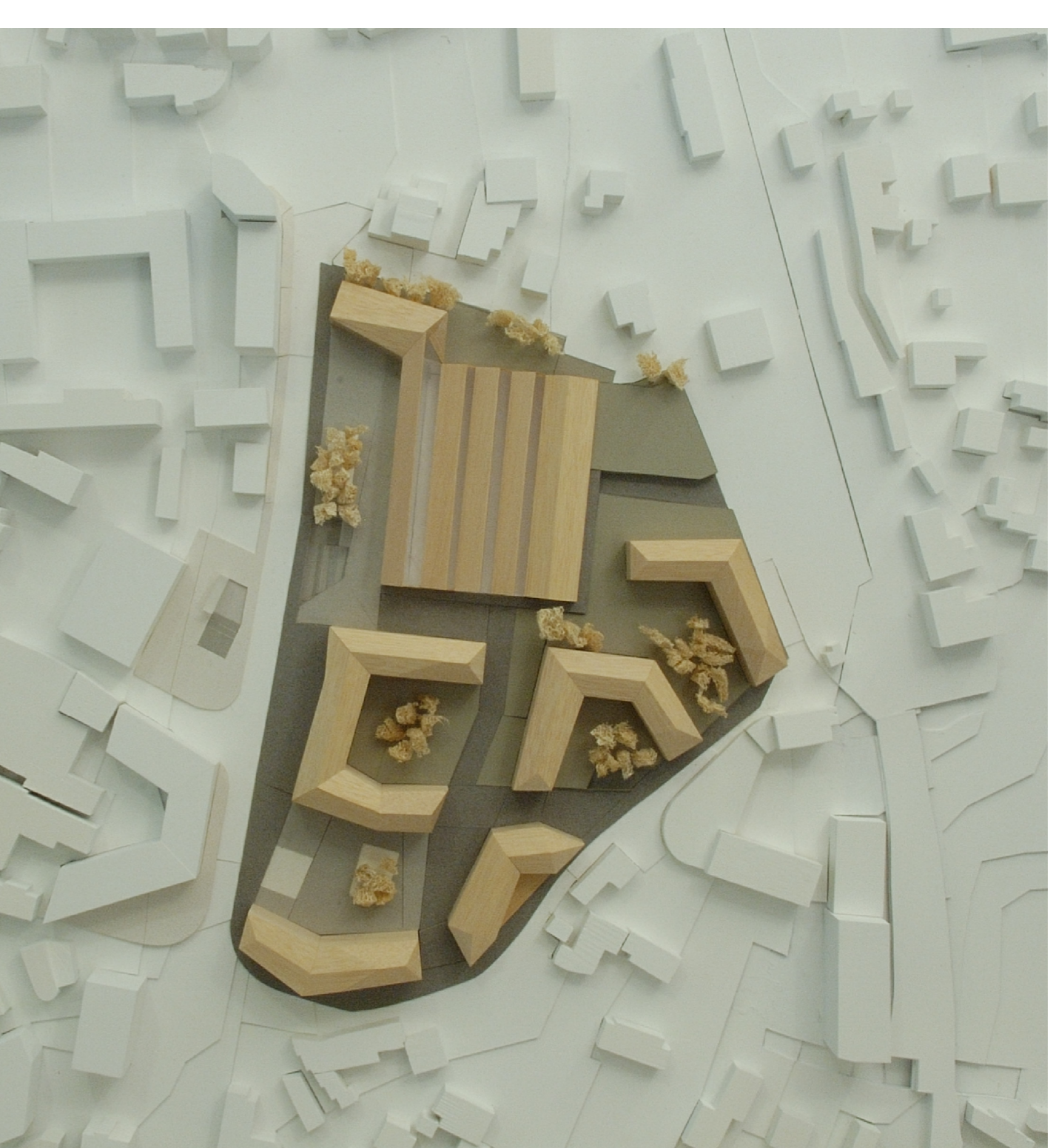
VISTA DEL MODELLO DALL'ALTO