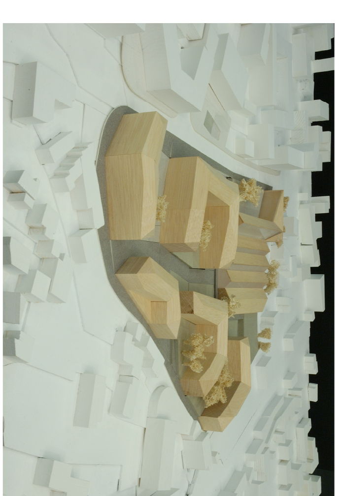
VISTA DEL MODELLO DA NORD-EST